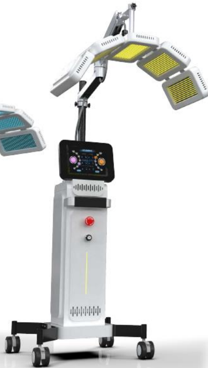
Dual Lumière I