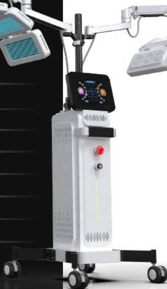
Dual Lumière II